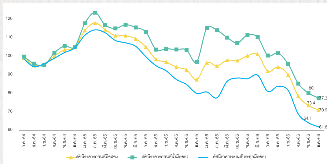
ดัชนีราคาการยกยดมือสองรายเดือน