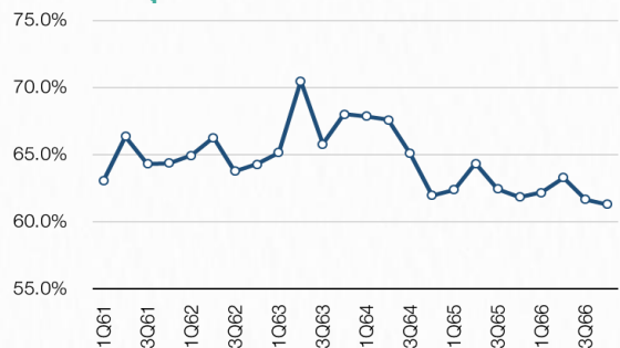
ต้นทุนกิจการโรงพยาบาลต่อรายได้