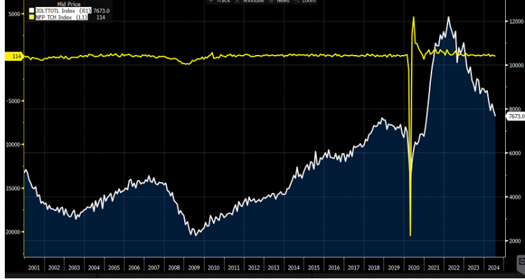
ที่มา: INVESTING, BLOOMBERG, สายงานวิจัย บล. เอเชีย พลัส

ดังนั้น ตลาดจึงประเมินว่า FED ควรที่จะลดดอกเบี้ยมากกว่าในการประชุมรอบ ก.ย. 67 โดยผลการสำรวจของ FED WATCH TOOL ให้น้ำหนักราว 44% ที่คาดว่า จะปรับลดดอกเบี้ย 50 BPS. ลงสู่ระดับ 5.00% และทยอยปรับลดดอกเบี้ยในการประชุมเดือน พ.ย.67 และ ธ.ค.67 อีกครั้งละ 25 BPS. จนคาด ณ สิ้นปีดอกเบี้ยจะอยู่ระดับ 4.50%