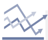
Chart of the day