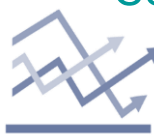
Chart of the day