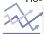
Chart of the day