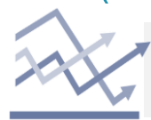
Chart of the day