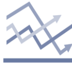
Chart of the day