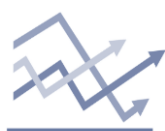
Chart of the day