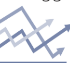
Chart of the day