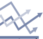
Chart of the day